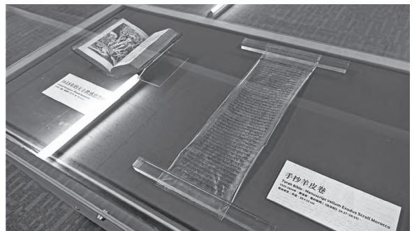
希伯來文手抄羊皮卷

每個人對於文物的收藏取決於自身如何認知他與文物的關係。透過文物的收藏，藏家即能對文物之起源、背景以及其本身之歷史進行研究。黃主任更感人的指出，任何一個人都不能稱自己為這些文物的擁有者，而是管理者，應該在適當的時機，以最適當的方式讓文物生命永續留存。