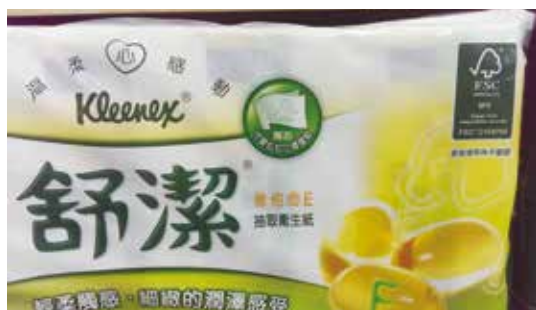
FSC™森林認證的舒潔抽取衛生紙

森林認證不只是應用於林產品或木製品而已，凡是和森林經營有關的各種森林特產物、副產品，都可做森林認證。例如，現在臺