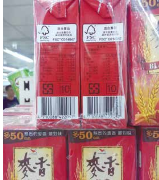
FSC™森林認證的麥香紅茶紙容器

灣已可見FSC™認證的衛生紙(舒潔、春風、蒲公英)、擦手紙(蒲公英)、筆記本(誠品)、卡片、信封、紙容器(麥香紅茶)、雜誌(天下)、及月曆等紙製品，國外尚有FSC™認證的各種家具及製材。此外，日本九州宮崎縣的FSC™認證木材乾香菇已於今年6月在臺北南港世貿國際美食展中推銷、展示。在臺灣高山地區種植山葵外銷日本雖然賺取外匯，但也造成山坡地水土保持及林地違法濫墾問題。如果我們能發展FSC™認證的山葵，並配合宣傳勸導日本消費者購買經FSC™認證的山葵，以免做為破壞臺灣水土保持的幫凶，如此將來林農生產無森林認證的山葵就可能受消費者抵制而沒有市場，林農便有誘因去改善林業經營，生產有FSC™認證的山葵。這種經由消費者導向及市場機制而改善臺灣林業經營及國土保安，並非不可能之事，只要政府有心推動，應可樂觀其成。至於FSC™認證木材乾香菇，臺灣也是可以跟進，目前臺灣私有林地的疏伐木，是可以用來生產木材香菇的，而台糖公司前兩年就早已經在花蓮區處用其林地上的造林疏伐木生產木材香菇，如果能再有FSC™認證，必定就能做市場區隔，提高木材香菇價格及銷售量，對友善環境有真正的幫助。♻️