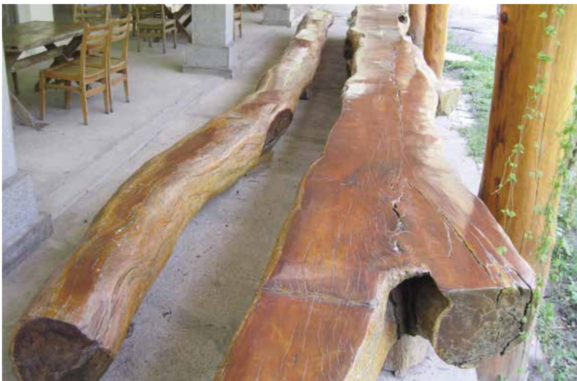
惠蓀林場咖啡園內陳列的臺灣相思樹風倒木，樹幹通直，色澤優美

據研究結果顯示，不同樹種的二氧化碳吸存量，以闊葉樹種較佳，在林齡20年生時之二氧化碳吸存量，以臺灣相思樹380.31 ton/ha最高，光蠟樹345.11 ton/ha第二，臺灣欒311.05 ton/ha第三。可見臺灣闊葉樹人工林之碳吸存潛力很大，尤其是原生樹種臺灣相思樹之碳吸存量最高，木材質地堅硬又色澤美麗，可做各種高級家具，也是優良的木炭原料，更是蕈菇用材的最好材料，將來若能選育出優良種源的臺灣相思樹，生長快速、樹幹通直，其有可能成為臺灣林業的明日之星。