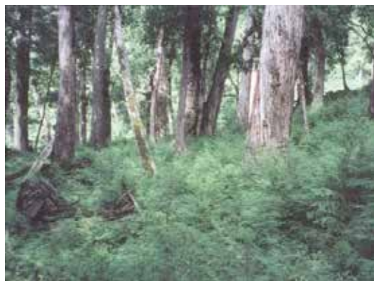
棲蘭山林區枯立倒木整理過的檜木林相