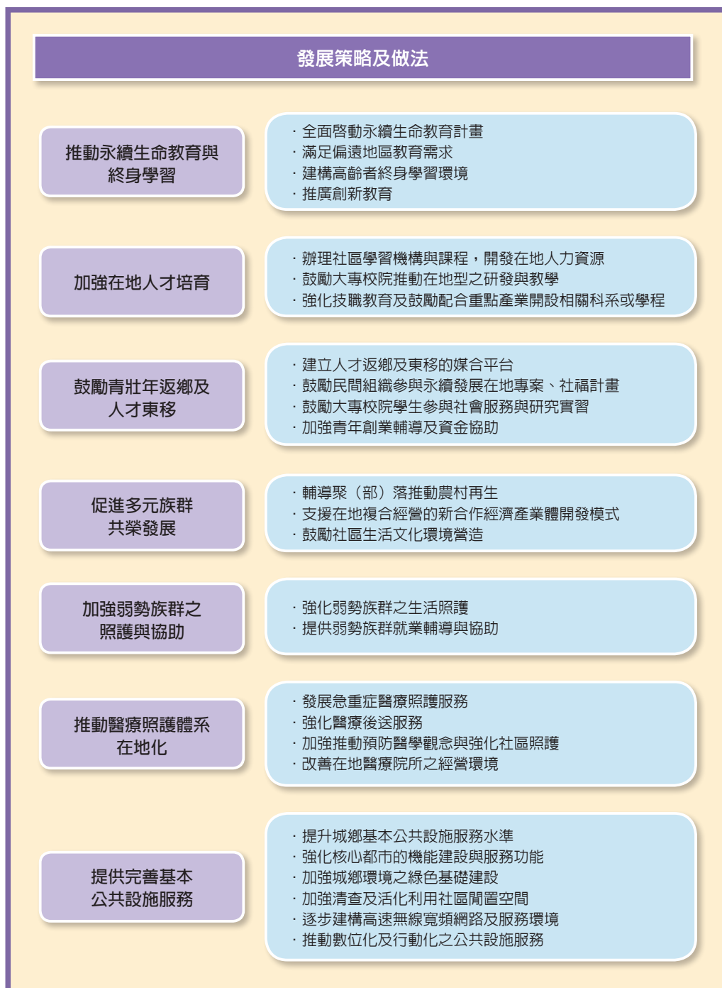
圖2 社會永續面向之發展策略及做法