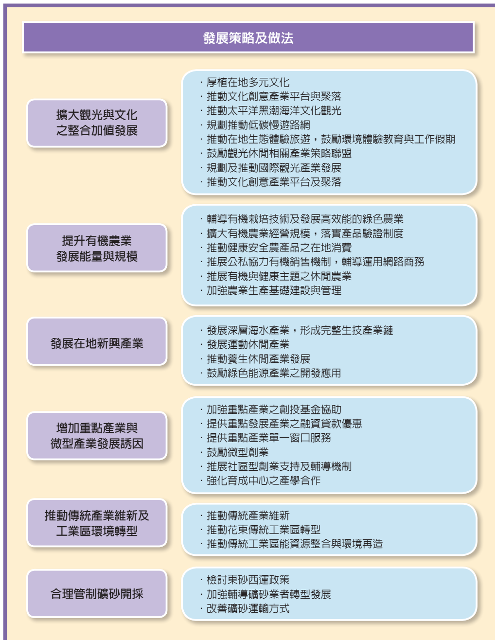
圖1 經濟永續面向之發展策略及做法