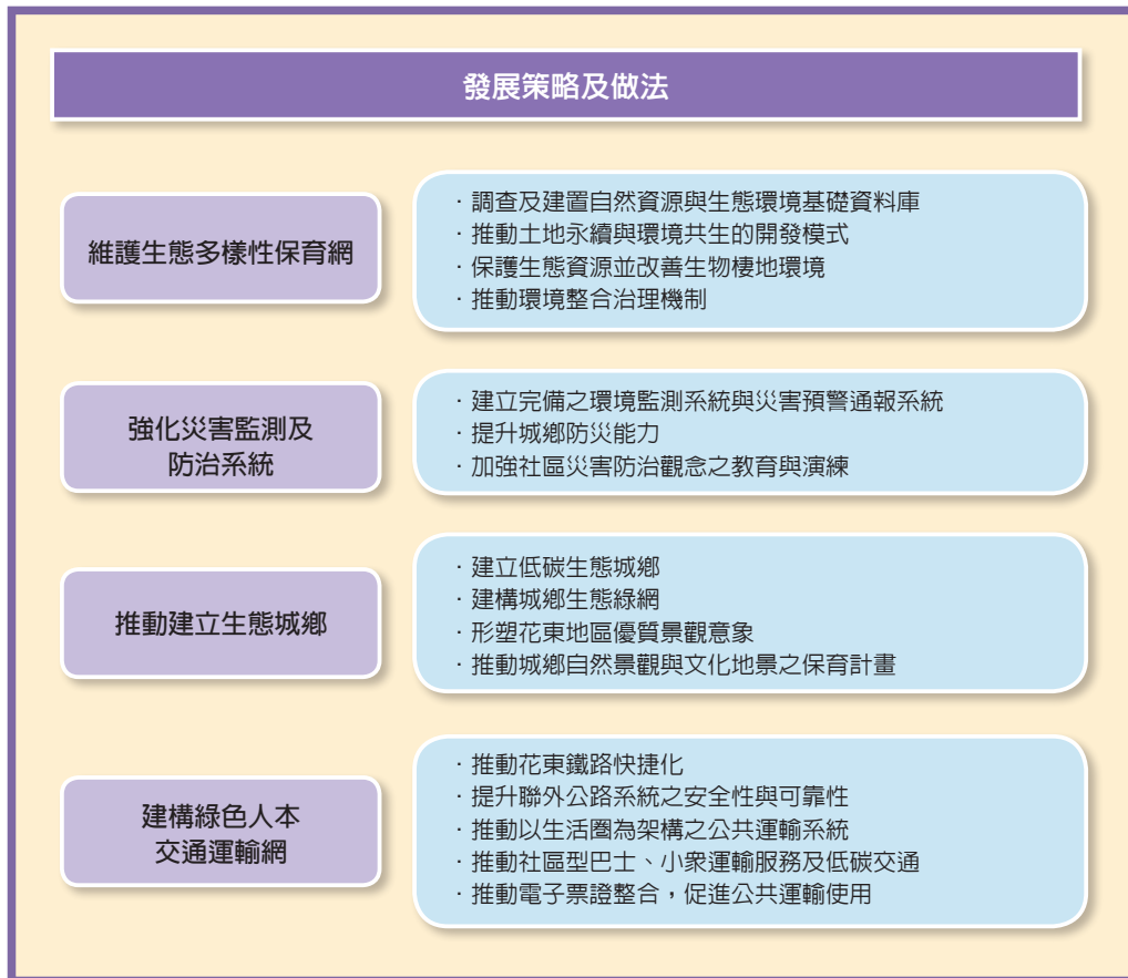
圖3 環境永續面向之發展策略及做法