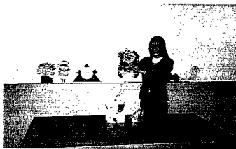
圖2「紙張超市」活動中以個性紙偶介紹各類紙張

「紙張超市」是針對「中華科技」展示廳中「造紙」單元發展而成的活動。本展示單元屬於比較靜態的展示方式，透過印花紙、灑金紙、填粉紙等各類紙張的陳列，以及圖片、幻燈投影方式，展現紙張的種類、造紙的過程與原理、造紙技術的傳播等內容。您或許對靜態的展示沒多大興趣，但「紙張超市」活動一定會讓您感覺造紙的神奇，本活動主要有二項重點：一為各類紙張的認識，另一為紙張的製造過程。在認識紙張方面，是由各種紙質製成的個性紙偶，分別介紹書面紙、報紙、銅板紙等生活中常見的紙張，以及它們的特性與用途（如圖2）。接著是紙張的製作過程，一般人對於蔡倫造紙的歷史耳熟能詳，但對於紙是如何製造出來的，卻是所知不多。本活動就以再生紙為例，示範紙張製造的幾項基本步驟，同時也讓您有機會，親身體驗打紙漿、抄紙、瀝乾、熨燙等造紙的過程。