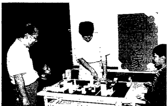
圖6.「魔幻之家」活動中觀眾利用迷你傢俱進行室內設計

您清楚家裡的房子由哪些建築材料構成的嗎？它們的特性又如何呢？我們每天接觸到許多的建築材料，但是大多數人可能是視而不見。「魔幻之家」是針對「居住與環境」展示廳中「建材與空間」單元發展而成的活動。在這個展示單元中，本來就有許多建材，例如木材、鋼材、混凝土、磚頭等，讓觀眾敲擊、觸摸，聽聽看它的聲音、感覺它的溫暖或冰冷，而且還有斗拱、鋼構及建築剖面等實際結構，讓您可以清楚的觀察。「魔幻之家」這個活動的設計就在讓您參觀後，可以加深對各種建築材料的認識及動手進行室內配置。活動先以兒歌導入主題，然後以提示材料特性與用途的問答遊戲，讓小朋友猜猜看是建築中所用的哪一種材料，例如木材、鋁、混凝土、磚、玻璃、瓦等。動手做部分，小朋友可以利用紙板、各種迷你傢俱模型，進行隔間、傢俱擺設，體會自我創作的樂趣（如圖6）。