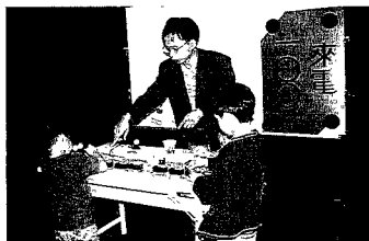
圖3「來電100」活動中小朋友試驗串並聯的不同

「來電100」是針對「電子世界」展示廳中「電子電路」單元發展而成的活動。在這個展示單元中，首先利用大型圖片、電漿球實物呈現大自然中雷電、極光等有關電的現象，說明電的發現，接著利用各式電子儀器讓觀眾可以操作瞭解電子的特性與控制，並以圖片及實物展現電子在飛航、電磁爐等的應用。由於「來電100」是以國小中低年級學生為對象，為避免內容過於抽象，因此選擇日常生活中，經常運用的基本電流迴路與電路串聯、並聯為主。活動配合展示內容先以故事開頭說明大自然中雷電、極光等有關電的現象，說明電的發現，接著利用設計好的迴路圈，以競賽方式讓小朋友瞭解電流、電壓及電路串聯、並聯的意義，最後利用電池、電路盤、燈泡等器具，讓小朋友實際進行串聯並聯的連接，並觀察效果之不同（如圖3）。