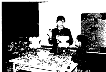
圖4「銅牆鐵壁」活動中利用立體模型介紹金屬特性

仍然似懂非懂，但是沒關係，參加了「銅牆鐵壁」活動，您一定會茅塞頓開。本活動首先透過保力龍球製成的立體模型，說明金屬材料中常見的三種晶格構造，包含體心晶格、面心晶格及六方最密晶格構造，以及常見金屬的物理、化學特性（如圖4）。可配合學校關於金屬材料之原子結構課程內容，非常適合國中以上學生。動手做部分，可讓您利用保力龍球與竹籤動手（亦可用紙黏土）組織三種晶格構造，非常清楚易學，經過實際動手做的過程，相信您將永難忘記。