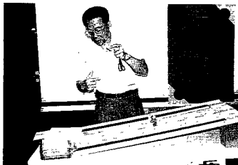
圖1.「童玩闖關」活動中的跳寶與斜面

「童玩闖關」是針對「動力與機械」展示廳中「斜面與摩擦力」單元發展而成的活動。跳寶和斜面是活動中的二位主角（如圖1）：跳寶是一種圓形空盒內裝有一顆彈珠，沿斜面下滑時，因彈珠移動造成重心變換而形成跳動現象；斜面則是由一般長形木板加方磚墊高而成，可換貼不同材質表面。它們製作簡單卻能用以說明許多科學原理，例如：當跳寶由斜面高處往下滑時，可以解說位能與動能間能量轉換的概念；斜面表面換上不同材質，觀察跳寶下滑運動的變化，可以解說摩擦力的作用；改變斜面角度或跳寶本身重量，都可以讓觀眾觀察到跳寶運動速率的變化，以及討論變化的成因與相關的科學原理。為了增加現場觀眾的參與感，和體驗動手做的樂趣，現場提供跳寶製作的紙模、不同高度和材質的斜面，以及觀察跳寶運動的紀錄表，觀眾可以自由索取、組裝和進行實驗記錄。